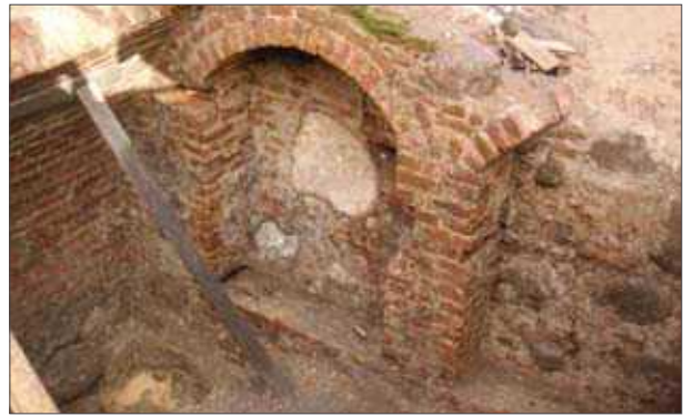
3 pav. 2008 m. atrastas XVI a. antrosios pusės rūsio fragmentas (Šv. Mikalojaus/Pranciškonų g. (Zilinskas, R.))

Akmuo vykusiai imituotas formuojant detales iš ypatingos sudėties skiedinio (Katedros šventoriaus