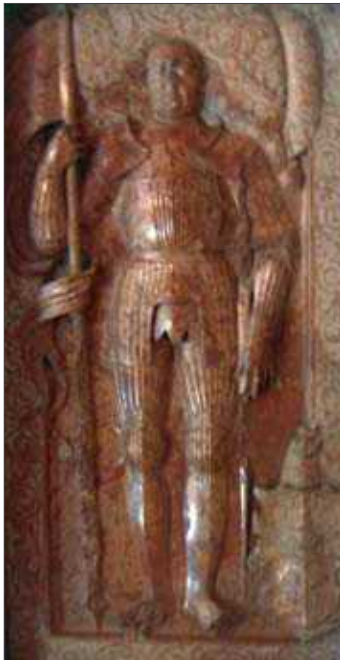
6 pav. Lietuvos kanclerio Alberto Goštauto antkapis Katedroje.