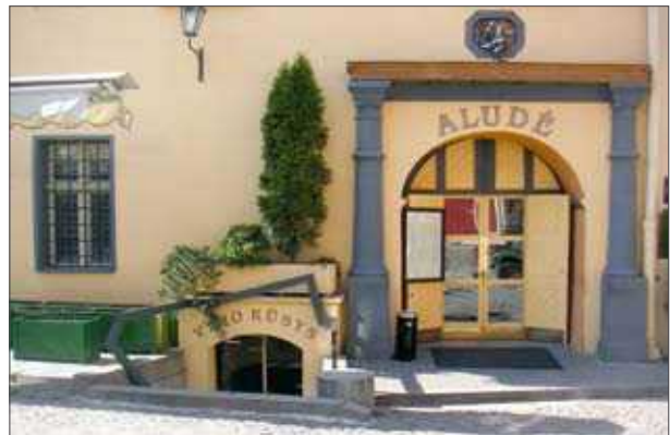
4 pav. XVI a. portalas Gaono g. 7/11

Fig. 3. Fragment of cellar of second half of 16th century st Mikalojus/Pranciškonai st (Zilinskas, R)