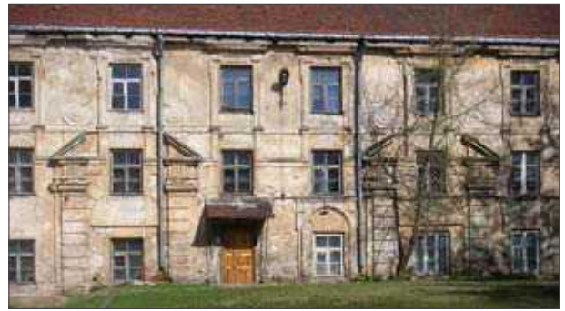
2 pav. Išlikusi Jonušo Radvilos rūmų dalis (Liejyklos g. 2). Rūmai laikomi paskutiniu renesanso architektūros pavydžiu Vilniuje. Atkaklų Radvilų prisirišimą prie renesansinės tradicijos galima paaiškinti jų priklausymu reformatų konfesijai