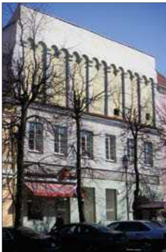
1 pav. Kapitulos namas Pilies g. 4.

Laikotarpis, kai buvo susidariusios prielaidos pasireikšti šiam stiliui, truko daugiau kaip 137 metų: nuo