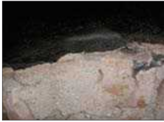
Universiteto g. 5. Universiteto Istorijos fakulteto pastatas. Išlikęs XVII a. pr. iš mūro suformuotas dūmtraukis, yra to paties laikotarpio pamatų aplink pastatą žemiau grindinio lygio (Zilinskas, R., 2006–2007).