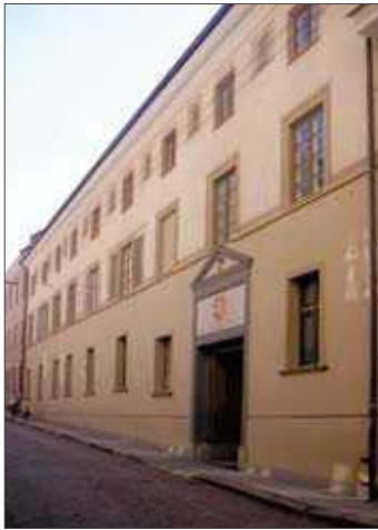
5 pav. Buvusi XVI a. kunigų seminarija, Universiteto g. 6.

XVI a. kunigų seminarijai Radvilų funduoti ir išplėstirūmai su sgrafito puošyba Universiteto g. 6 (dabar Lietuvos Respublikos prezidentūros kanceliarija). Dabartinis trečiasis aukštas įrengtas atiko vietoje [11]