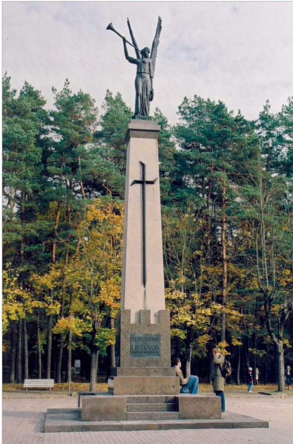
2 pav. Laisvės paminklas, pastatytas 1928 m., skulptorius Antanas Aleksandravičius. Nugriautas 1948 m., atkurtas 1991 m. (atkūrė skulptorius Jonas Meškelevičius, archit. Algirdas Mainelis)

Fig. 2. Monument "Freedom" (1928). Sculptor Antanas Aleksandravičius. Demolished in 1948, restored in 1991 (sculptor Jonas Meškelevičius, arch. Algirdas Mainelis)