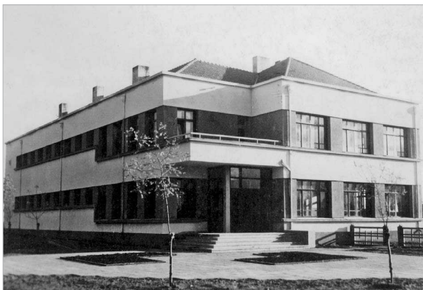
6 pav. Alytaus pradinė mokykla Nr. 4 Birutės g. 26, pastatyta 1937 m., archit. Vytautas Trečiokas (1939 m. nuotrauka)

Fig. 5. Private dwelling house in new town, Maironis str., built before the War