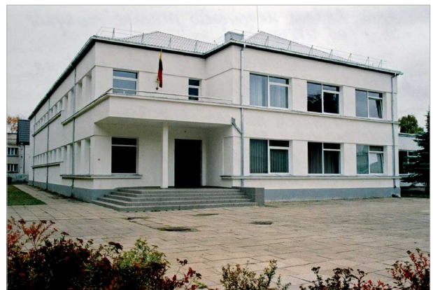
7 pav. Alytaus senamiesčio pradinė mokykla dabar (po rekonstrukcijos)

Fig. 7. Elementary School of Alytus old town (after reconstruction)