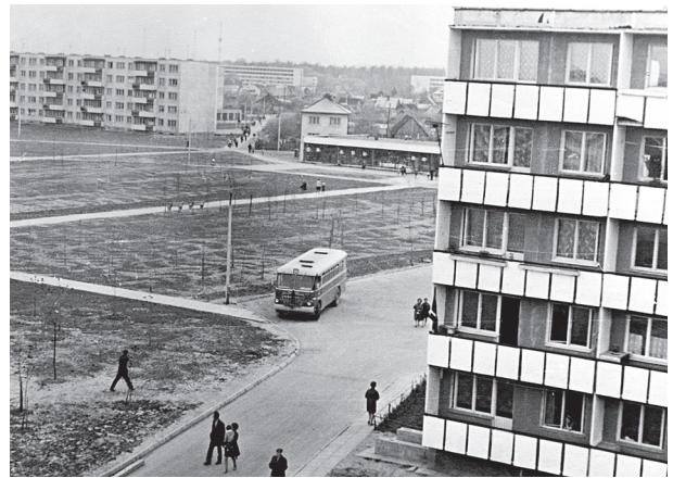
1 pav. Kauno Dainavos mikrorajono statybos apie 1967 m.

Panašaus požiūrio susiformavimui neabejotinai didelę reikšmę turėjo ne tik jau minėtos sovietinės epochos sąlygos, ribojusios architektūrinės raiškos galimybes, bet ir itin staigus bei radikalus kultūrinis lūžis socialinei aplinkai transformuojantis nuo sovietinių metų realijų prie Vakarų kultūros ir vartotojiško gyvenimo stiliaus. Tokiame kontekste jau pačios savaime asketiškos modernizmo formos, dar labiau nuskurdintos medžiaginių sovietinių metų problemų, vargu