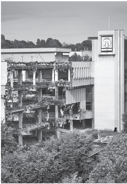
2 pav. „Merkurijaus“ griovimo procesas. 2009 m.

Fig. 2. The process of demolishing „Merkurijus“. 2009