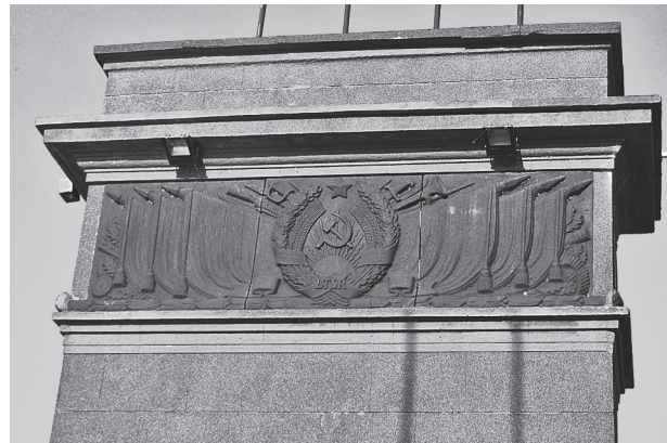
4 pav. Išlikę ideologiniai ženklai ant tilto per Nemuną Kaune 2009 m.

Tad jei sovietinės Lietuvos architektūrą vertin- sime kaip svetimės šalies bei ideologijos liudijimą, reikšmingiausi pavyzdžiai neabejotinai siesis su so- cialistinio realizmo epochos palikimu. Žvelgiant iš šiandieninės paveldosaugos perspektyvos, ideologinių reikšmių prisodrinta pokario architektūra galėtų būti interpretuojama remiantis San Antonio deklaracijoje išsakytais principais. Nors dokumentas daugiau skirtas Amerikos problematikai, tačiau kelia svarbų, viena- me objekte konfliktuojančių reikšmių bei identitetų klausimą: „reikšmių ir vertybių variacijos objekte tam tikrais atvejais gali konfliktuoti, ir kadangi konfliktų sprendimui būtinas tarpininkavimas, konfliktiškumas iš esmės gali padidinti paveldo, kuris yra įvairių grupių požiūrių susiliejimo taškas, vertę“ (The Declaration ... 1996). Taigi kaip bene svarbiausias su nematerialiuoju aspektu išskylantis uždavinys – daugialypio „naujojo identiteto“ (Wieszczek, Oliveira 2010: 66) kūrimas, kuris sudarytų erdvę ir sąlygas šias struktūras saugoti