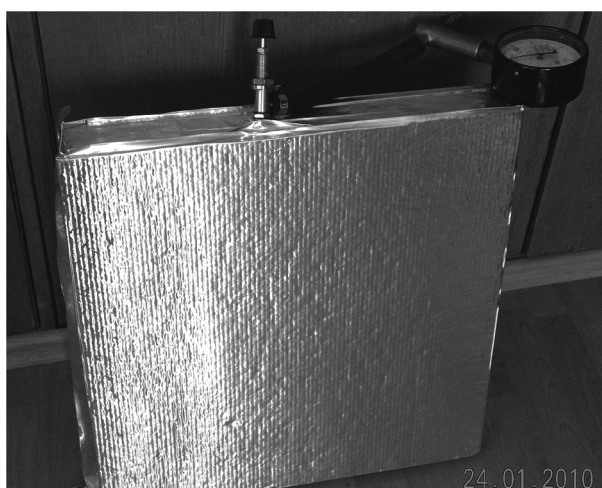
3 pav. Vakuuoti šiaudai metalizuotame maiše