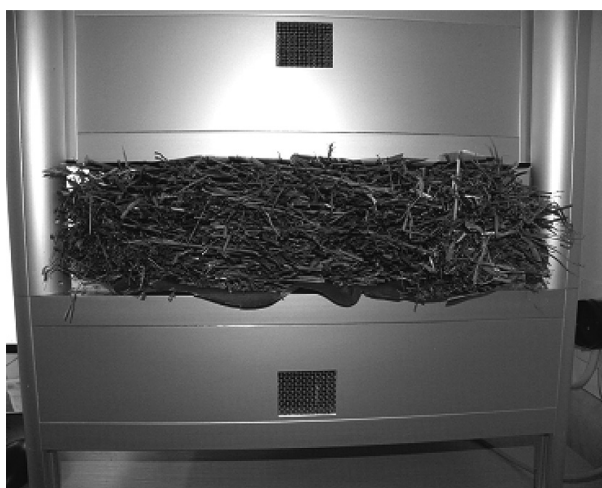
2 pav. Šiaudų šilumos laidumo koeficiento tyrimai laboratorinėmis sąlygomis, esant 10 °C vidutinei bandinio temperatūrai