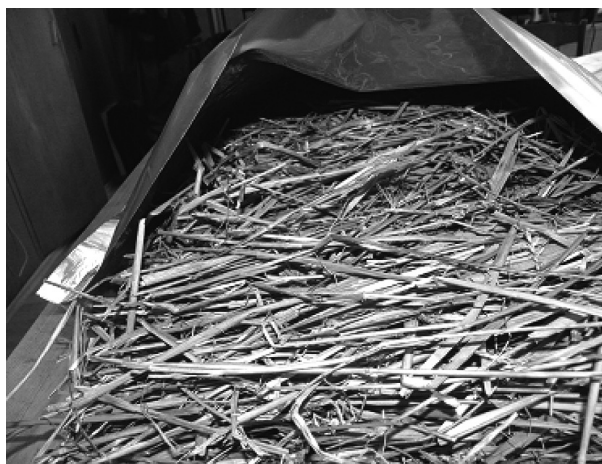
1 pav. Horizontaliai orientuoti šiaudai sudėti į metalizuotus maišus